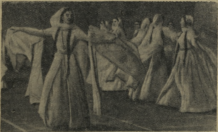
Москва. Декада грузинского искусства и литературы. В концертном зале имени П. И. Чайковского состоялось выступление Государственного ансамбля народного танца Грузии.