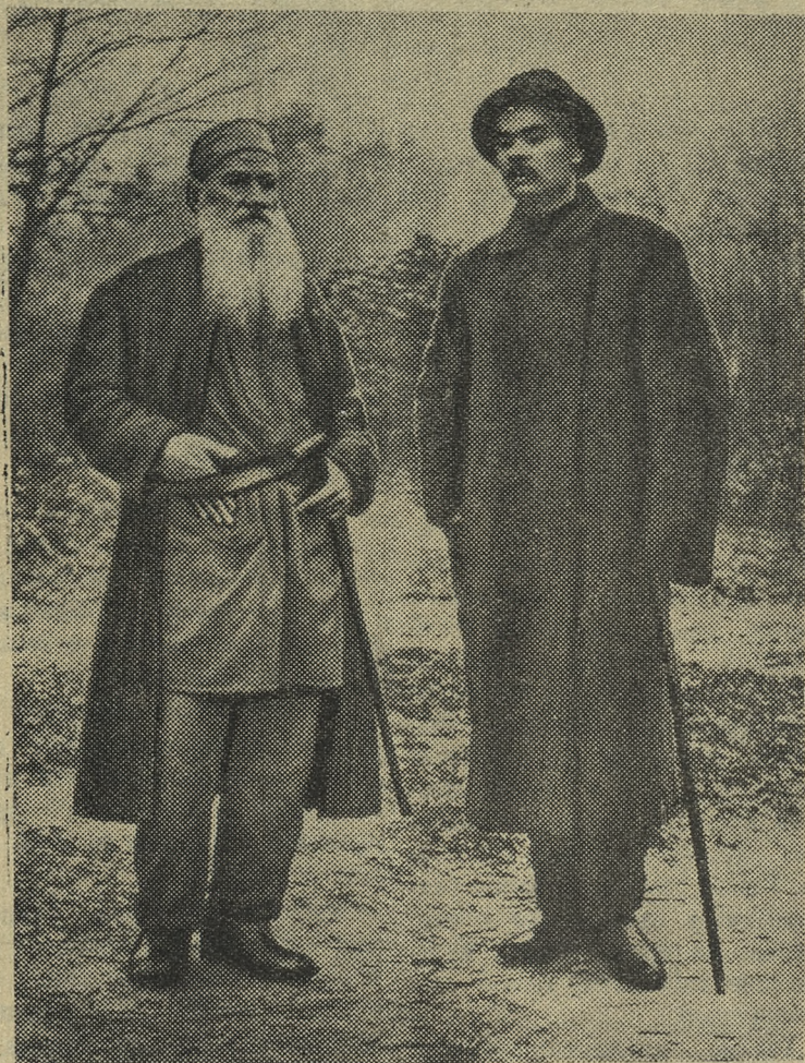
На снимке: Л. Н. Толстой и А. М. Горький в Ясной Поляне (1901 год).

Представители американских военно-воздушных сил утверждают, что бомбардировщик «случайно» выпустил несколько снарядов, оставшихся после учебной стрельбы.