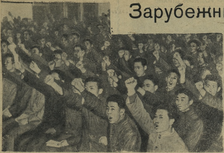
Трудящиеся Корейской Народно-Демократической Республики горячо поддерживают новые предложения правительства КНДР по вопросу мирного объединения Кореи. По всей стране проходят митинги в поддержку этой инициативы. На снимке: митинг студентов Кимчакского инженерного института в поддержку заявления Кабинета министров КНДР.