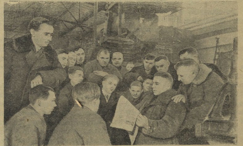
Киевская область. С большим воодушевлением встретили механизаторы Бориспольской МТС постановление Пленума ЦК КПСС «О дальнейшем развитии колхозного строя и реорганизации машинно-тракторных станций».

В командном зачете после трех дней соревнований впереди команда Москвы. На втором месте — первая команда РСФСР, на третьем — горнолыжники Казахстана.