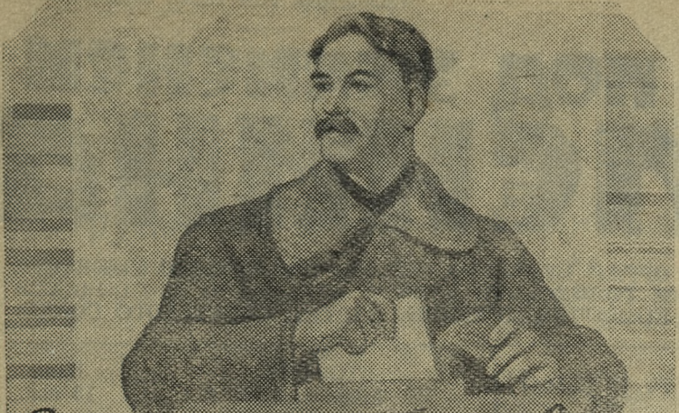
За дальнейший расцвет нашей Родины

Участники собрания обсудили и приняли обращение и обязательства на 1958 год. Передовикам сельскохозяйственного производства были вручены Почетные грамоты горисполкома и горкома КПСС.