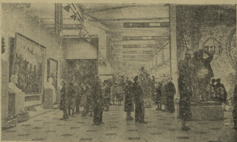
Москва. Всесоюзная художественная выставка в Центральном выставочном зале (бывший Манеж), посвященная 40-летию Великой Октябрьской социалистической революции. На снимке: посетители осматривают выставку.

Выявлены новые перспективные участки, изобилующие нефтью и газом. Разведка проводится в восьми районах Ставропольского края.