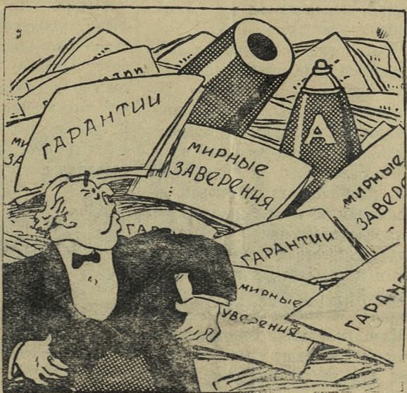
— Кажется, мы еще маловато сделали мирных заверений...

ЛОНДОН, 12 декабря. (ТАСС). Как сообщает корреспондент агентства Рейтер, 10 декабря в Никозии в течение целого дня продолжались столкновения между полицией и населением Кипра. Население требует предоставить Кипру права на самоопределение. Было ранено 20 патриотов и 8 полицейских. Один полицейский убит. Всего за последние два дня на Кипре убито 131 человек.