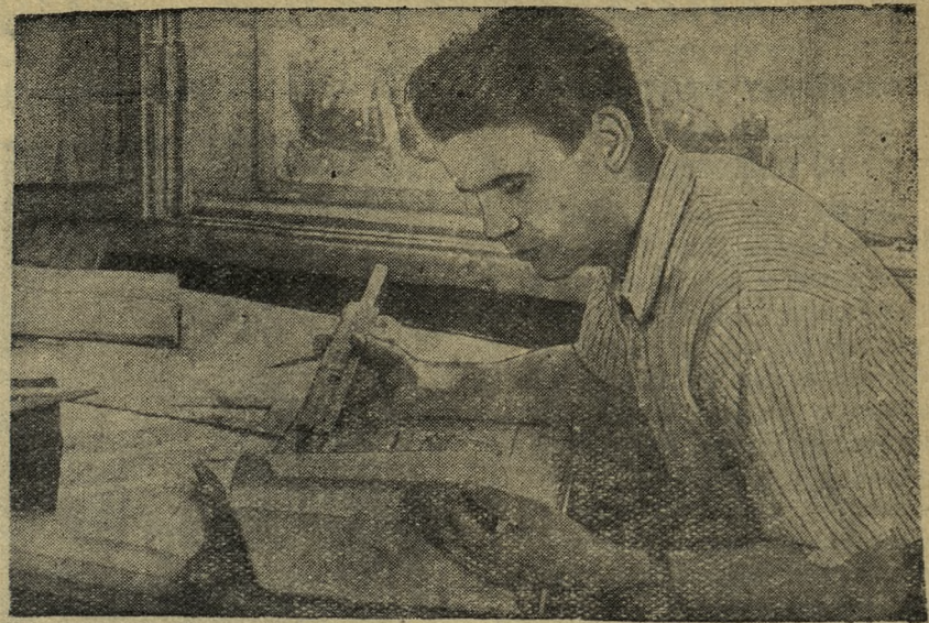
НАД КУРСОВЫМ ПРОЕКТОМ

Хочется пожелать нашей смене — молодежи — активнее участвовать в рационализаторской деятельности.