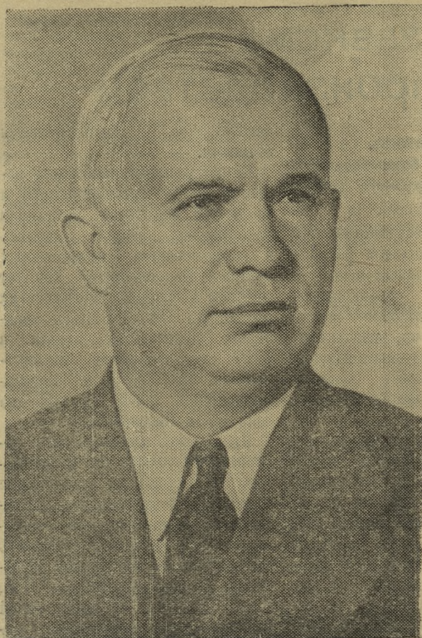
Н. С. ХРУЩЕВ