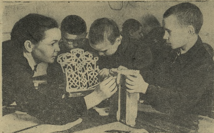
Хорошо поработали ученики младших классов во время каникул в кружках детской технической станции клуба Металлургов. Художники, столяры, выжигальщики подготовили выставку своих работ.

На снимке: члены кружка «Умелые руки» собирают сделанные ими ажурные полочки.