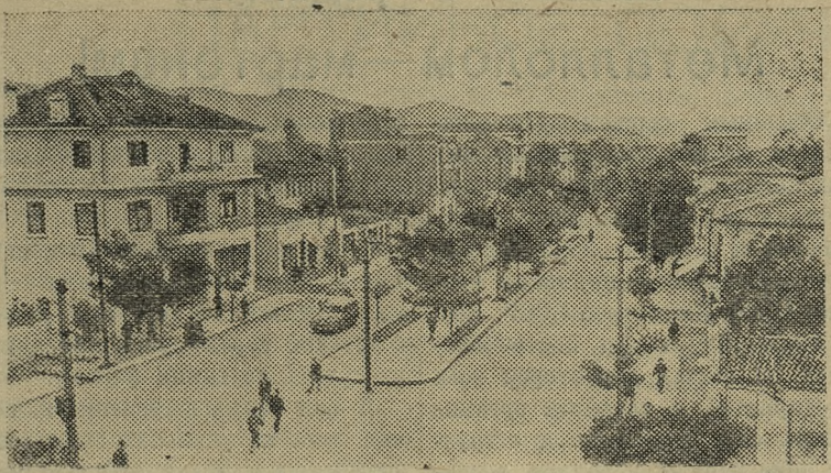
Столица Народной Республики Албании — город Тирана.