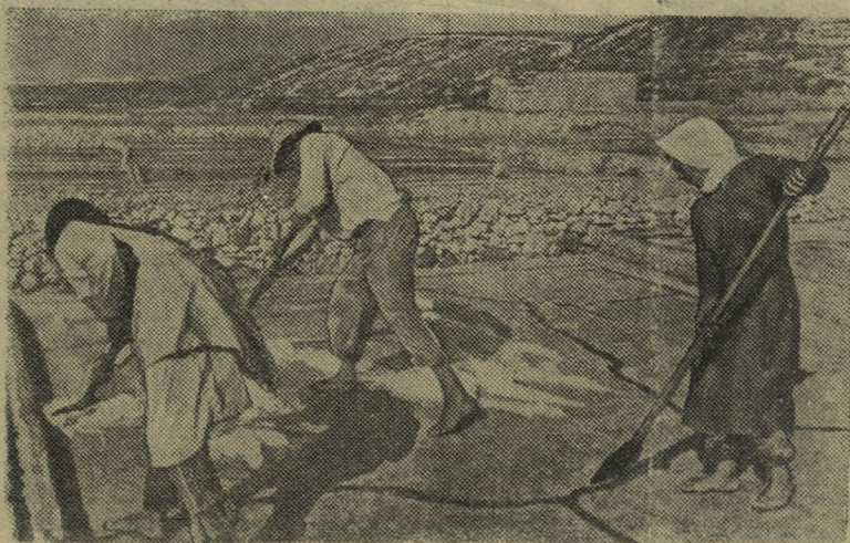
Ливан. На соляных промыслах вблизи города Триполи.

ПРОДОЛЖАЕМ РАЗГОВОР О ВОСПИТАНИИ ДЕТЕЙ В СЕМЬЕ