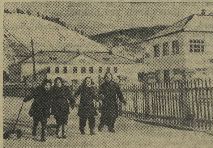
Красноярский край. Там, где сооружается Абаканский железный рудник, вырос поселок строителей и горняков — Абаза. За последнее время здесь построено много жилых домов, две школы-десятилетки, детский сад, ясли и другие культурно-бытовые учреждения.