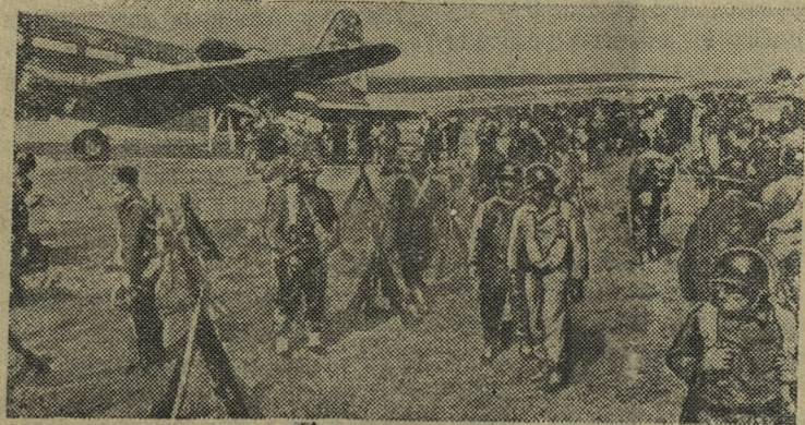
Куба. Террористический режим диктатора Батисты держит исключительно на штыках армии.

РИМ, 8 марта. (ТАСС). По сообщению агентства Анса, на 1 января 1957 года население Италии составляло 47.337 тысяч человек.