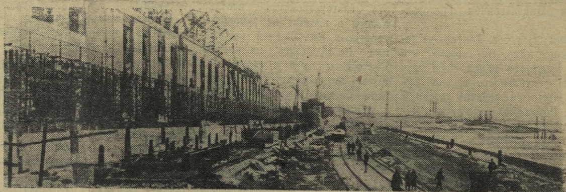
На строительстве Куйбышевской ГЭС. Наряду с постройкой здания ГЭС, водосливной плотины и шлюзов сейчас ведется прокладка шоссе и железных дорог через основные гидротехнические сооружения.

Руководителям металлургических предприятий дано указание оказывать индивидуальным застройщикам всестороннюю помощь. (ТАСС).