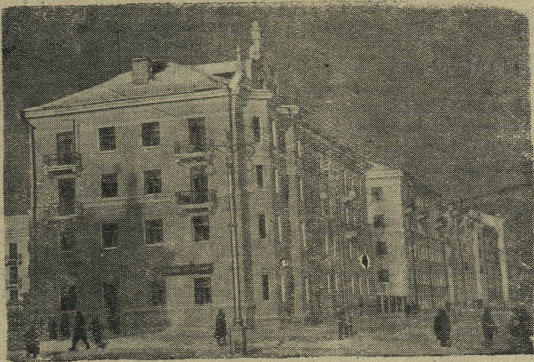
Новые дома по улице Ватутина.