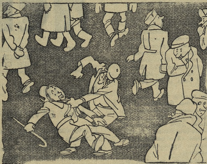
Из выступления тов. ДЕВЯТКИНА, начальника городского отдела милиции

В нашем городе имеются все возможности для культурного отдыха. Но весело, культурно провести досуг мешают часто хулиганы. Расскажу о некоторых из них.