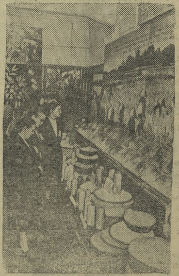
Ленинград. Выставка «Демократическая Республика Вьетнам» во Дворце культуры имени Первой пятилетки.

Белорусский народ свято чтит память пламенного революционера. Вблизи хутора Дзержиново, где он родился, в деревне Петриловичи, открыта мемориальная доска. В районном центре — городском поселке Ивенец установлен бюст Феликса Эдмундовича. Принято решение создать в Ивенецком музее Ф. Э. Дзержинского. Он будет открыт в центре города в двухэтажном здании.