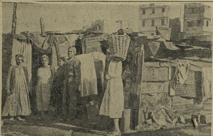
Порт-Саид. В результате англо-французской агрессии тысячи жителей Порт-Саида лишились крова. На снимке: в квартале Аль-Манах. Население ютится в наскоро сколоченных хижинах.

Пимокатная мастерская, находящаяся по ул. 1-я Красноармейская, д. № 23, принимает заказы из давальческой шерсти на изготовление валенок. Срок изготовления 20 дней.