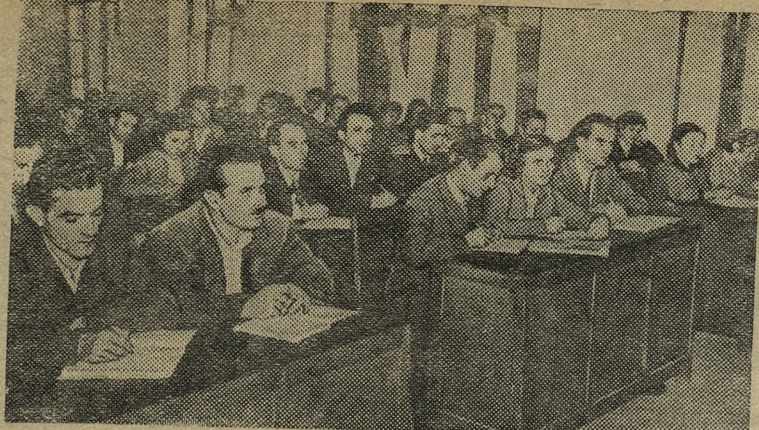
В последние годы в Народной Республике Албании организована подготовка квалифицированных кадров без отрыва от производства. В столице республики — Тиране создан Вечерний экономический институт. В нем занимаются передовики производства, хозяйственные руководители, директора предприятий. На снимке: на лекции в Вечернем экономическом институте.

В связи с создавшимся положением премьер-министр Индонезии Али Састроамиджой совещался с президентом Сукарно, после чего созвал заседание правительства.