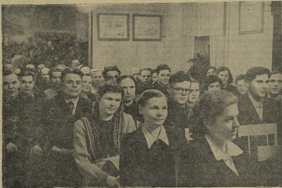
В зале заседаний

Одно время редакция городской газеты на своих страницах публиковала фельетоны, где едко высмеивались порочный стиль работы отдельных руководителей, люди, нечистоплотные в быту. А вот в последних номерах фельетоны отсутствуют. Надо, чтобы критических материалов в нашей газете было как можно больше.