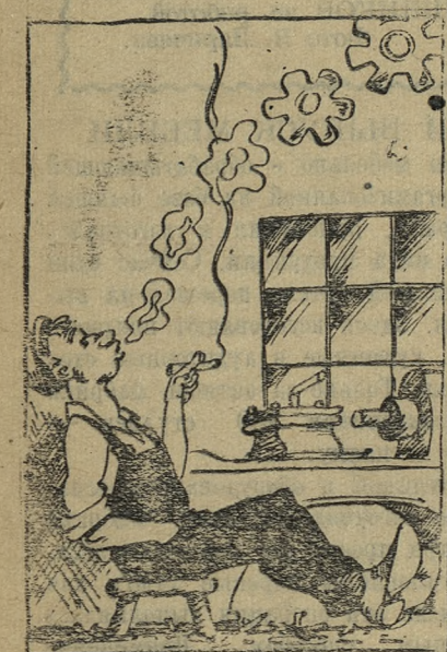
«Выработка» за день.