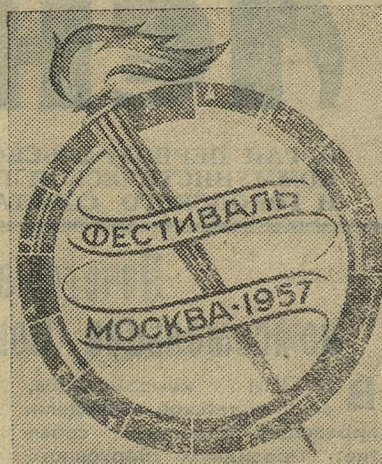
Эмблема Всесоюзного фестиваля Советской молодежи (автор эмблемы — художник А. Антонченко).