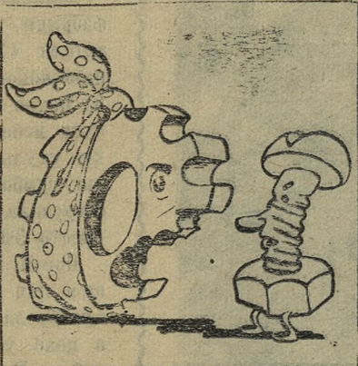
— Что с тобой?! — Мне бракодел зубья выбил...

Есть еще среди молодежи и комсомольцев завода бракоделы и нарушители трудовой дисциплины, с которыми надо вести непримиримую борьбу. (Из доклада А. Фотова и делегатов конференции).