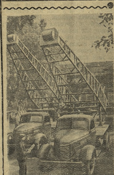
Азербайджанская ССР. На Бакинском заводе передвижных бурильных машин собраны два передвижных бурильных агрегата для Индии.

Агрегаты представляют собой портативные бурильные станки, смонтированные на автомобилях. Станки оборудованы буровыми вышками, грязевыми насосами, роторами, лебедками, необходимым бурильным инструментом и приспособлениями. Машины этого типа прошли промышленное испытание при разведочном бурении на нефть и воду в разных нефтяных районах страны, на целинных землях и продемонстрировали высокие эксплуатационные качества.