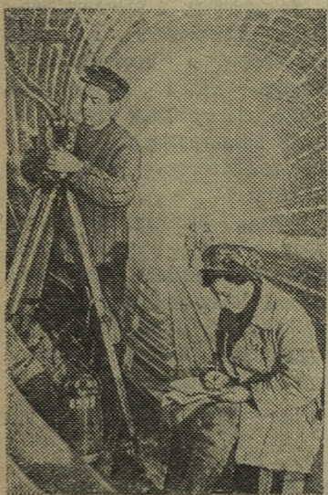
Москва. Строительство 5-й очереди метрополитена имени В. И. Ленина.