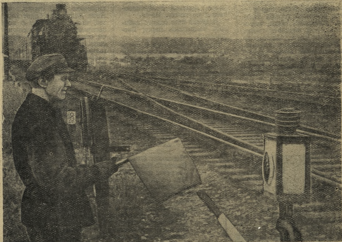
Фото и текст Л. Ларичева.

чится. Строительством кухни руководит коммунальный отдел ЖКО во главе с тов. Баевым. Работа пущена на самотек, рабочей силы выделено мало, строительные материалы не доставляются.