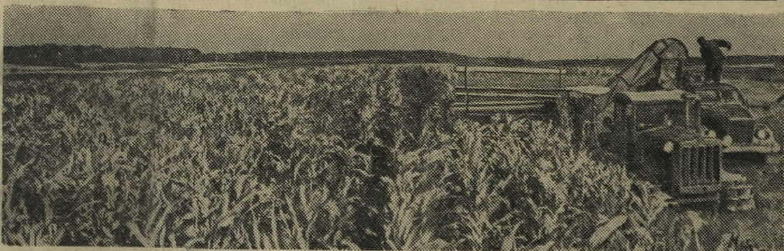
Калининская область. В текущем году колхозы и совхозы трудятся над тем, чтобы заготовить на каждую голову крупного рогатого скота по 25 центнеров грубых кормов, 7 тонн силоса, в том числе 5 — 6 тонн кукурузного. В передовых артелях Калининского района — имени М. И. Калинина и «Правда» на больших площадях выращен хороший урожай этой культуры, на отдельных участках убирают по 350 — 430 центнеров зеленой массы с гектара. На кукурузных полях этих колхозов работают силосоуборочные комбайны. Они скашивают растения, измельчают их и на ходу погружают измельченную массу в автомашины, которые доставляют ее к силосным ямам и траншеям.

Принимая обязательства в честь праздника, горняки дали слово выдать в октябре сверх плана еще 600 тонн концентрата. С первых дней октября среди смен развернулось соревнование за выполнение обязательств.