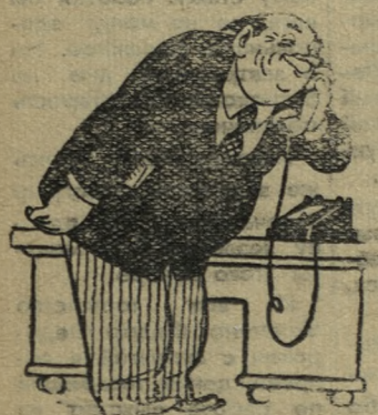
... с начальником...