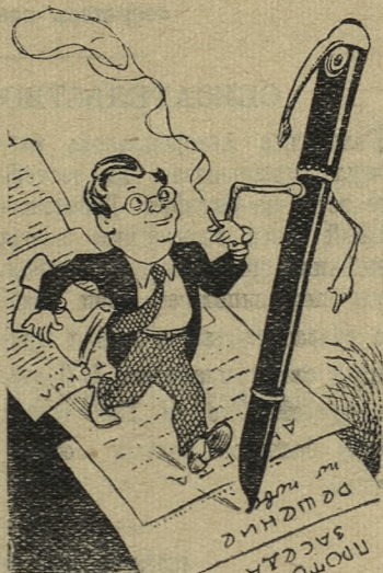
Ручководство Рис. К. Елисеева.

— Докладчик не остановился на вопросе подбора и воспитания кадров, — говорит тов. Лузин, секретарь парторганизации завода крупнопанельного домостроения. — Наш завод новый. Казалось, следовало бы подобрать кадры опытные, технически грамотные. Но до последнего времени этого не было сделано, что сказалось на выполнении плана.