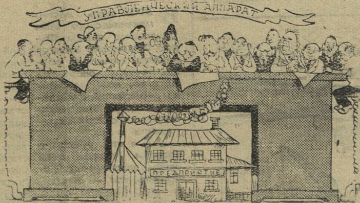
Кое-где и так бывает. Рис. Е. Ведерникова.

Для подготовки партсобраний очень мало привлекается коммунистов. Поэтому на собраниях выступают одни и те же товарищи. В докладе ничего не сказано о привлечении женщин к партийной работе. И не случай-