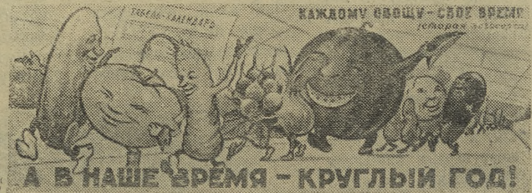
Плакат художника Б. Аржекаева, выпущенный ИЗОГИЗ.