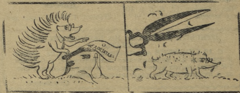
Выступление и... «наказание».