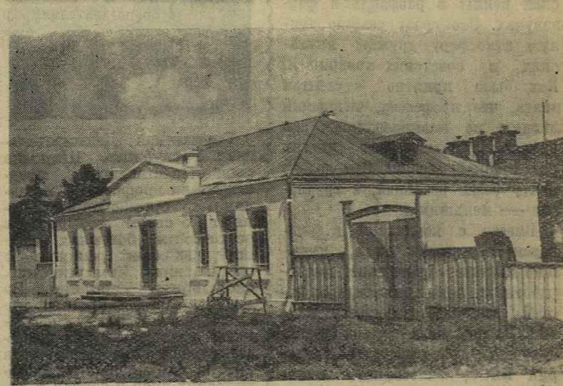
В поселке Билимбай открылся новый магазин на пять рабочих мест. Здесь есть галантерея, трикотаж, обувь. За первые три дня работы магазин продал товаров на 109 тысяч рублей. На снимке: новый универсам.