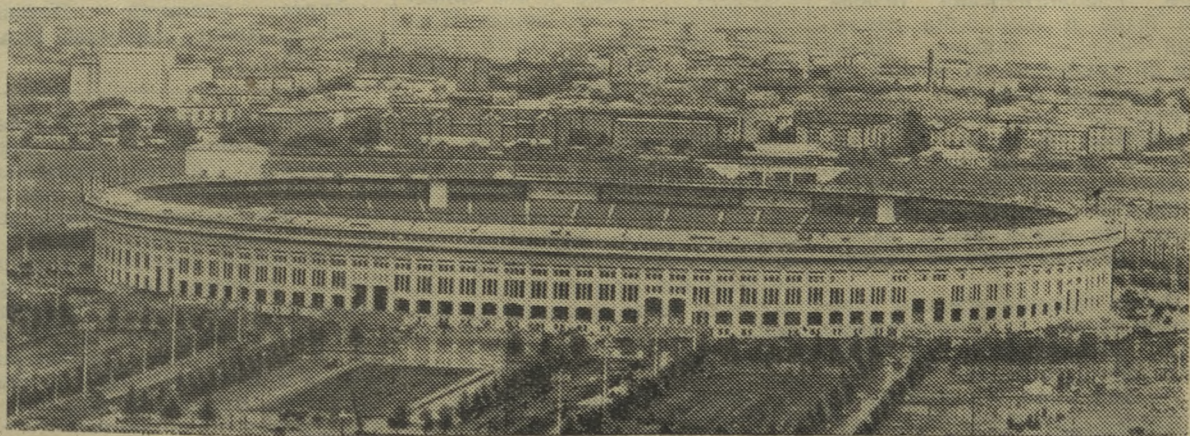
Москва. Центральный стадион в Лужниках. Большая спортивная арена.

Коллектив наших новаторов в начале года обратился к рационализаторам и изобретателям баллонного цеха завода имени В. В. Куйбышева в городе Жданове с призывом — развернуть соревнование за технический прогресс баллонного производства. Ждановцы откликнулись на наш призыв, в свою очередь предложили организовать обмен