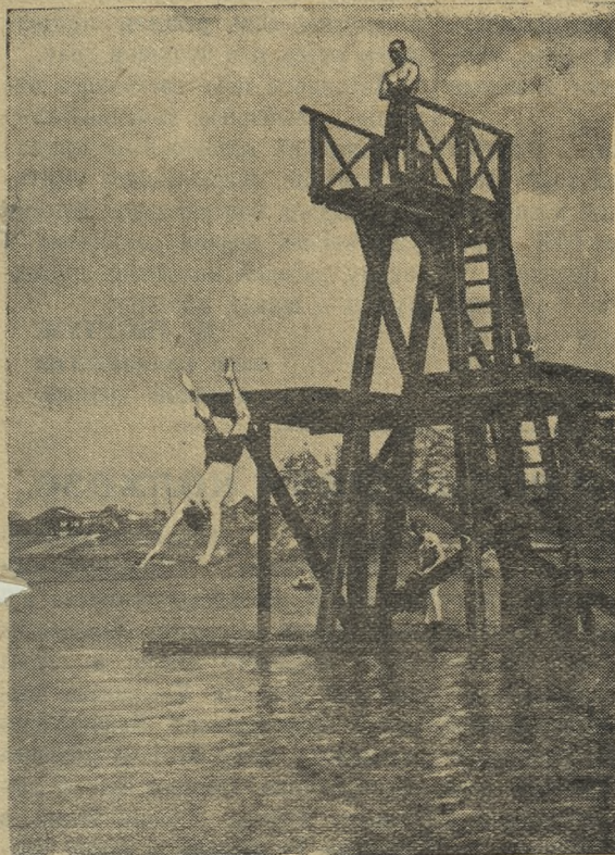
На Билимбаевском пруду.