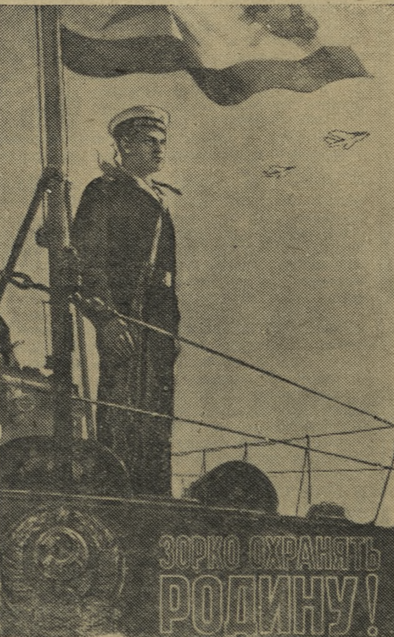
Плакат работы художника В. Лыкова (Государственное издательство изобразительного искусства).

13. В связи с тем, что в соревновании коллектива Первоуральского промкомбината с коллективом Ново-Уткинского промкомбината и коллектива Новотрубного завода с коллективом Старотрубного завода не выполнены условия соревнования и социалистические обязательства первенства этим коллективам не присуждать.