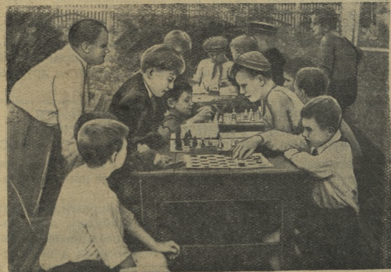
Весело живут в своем пионерском лагере дети трудящихся Уралтяжтрубостроя. Дальние походы, вечера у костров, спортивные соревнования, вечера загадок и русских сказок надолго останутся в памяти ребят.

На снимке: участники шахматно-шашечного турнира, проводимого в лагере на первенство.