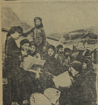
На полях Венгрии идет уборка урожая.

На снимке сверху: уборка озимого ячменя в Томпайском государственном хозяйстве (область Бач-Кишкы).