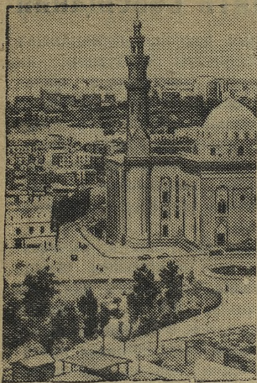
Египет. Вид части города Каира.