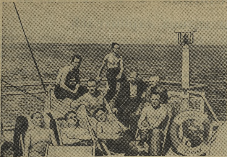
Польская Народная Республика. Недавно судно «Мазовше» совершило 5-дневный рейс по Балтийскому морю вдоль берегов СССР, Финляндии, Швеции и Польши. На борту парохода находилась большая группа польских туристов.

На снимке: участники рейса — рабочие металлургического завода имени Костюшко на палубе «Мазовше».