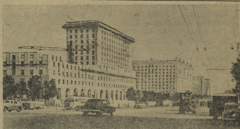
Москва сегодня. Строительство новых жилых домов на Ярославском шоссе.

В ближайшие годы намерено открыть еще 200 школ-интернатов. Для них построены новые здания по типовым проектам.