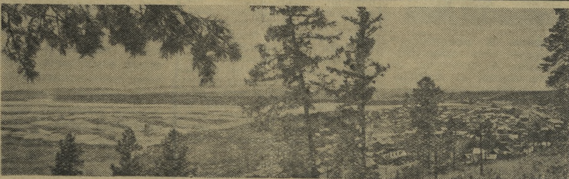
На строительстве Братской гидроэлектростанции.

Общий вид временного поселка строителей Падун. Слева — Падунский порог.