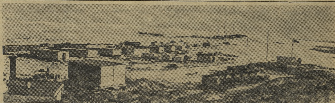
Первая Советская комплексная антарктическая экспедиция. Поселок Мирный.

В СССР придается важное значение производству полупроводников. В 1955 году выпуск их увеличился по сравнению с 1952 годом в 8,3 раза, а в 1960 году он возрастет по сравнению с тем же годом в 10 тысяч раз.