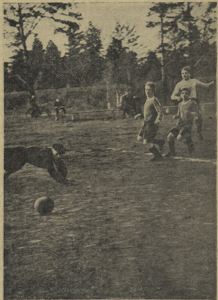
Открытие стадиона Магнитки. На снимке — момент игры футбольных команд авторемзавода и строителей.

В № 126 газеты на первой полосе допущена опечатка в подписи под фотоснимком. Следует читать: «Три года работает Наталья Краснова стрелочницей в железнодорожном