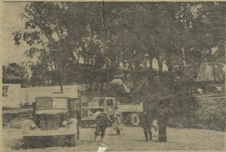
На снимке: благоустройство стадиона Старотрубного завода.

ВЕСЕЛО и разумно проводят свой отдых дети в пионерском лагере.