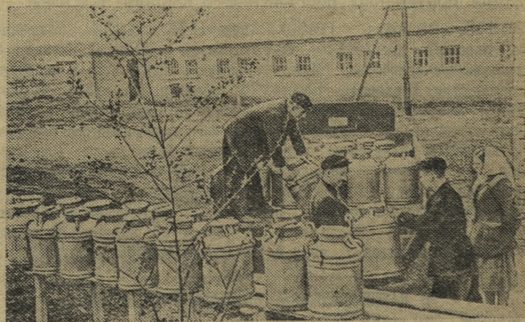
Воронежская область. Колхоз имени Хрущева Семилукского района одним из первых в области выполнил годовой план сдачи молока государству. Сейчас продолжается его сверхплановая продажа. Ежедневно колхоз отправляет до 1.250 килограммов молока. Доярки взяли обязательство — получить за год от каждой коровы не менее 3.200 килограммов.

На 328 тысяч рублей завысила себестоимость продукции рудопроизводство. Особенно неудовлетворительно обстоит дело с режимом экономии и выполнением социалистических обязательств на заводе сантехизделий. За пять