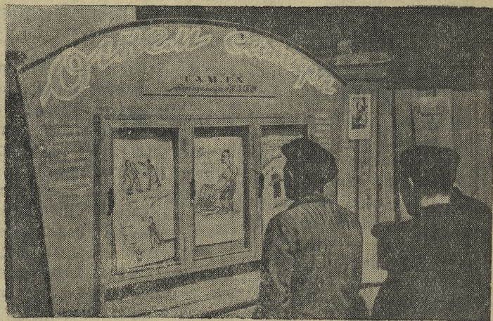
Большой авторитет у жителей Первоуральска завоевала газета «Огнем сатиры» — орган горкома ВЛКСМ. Она бичует нарушителей трудовой дисциплины, пьяниц и дебоширов, бракоделов и хулиганов.