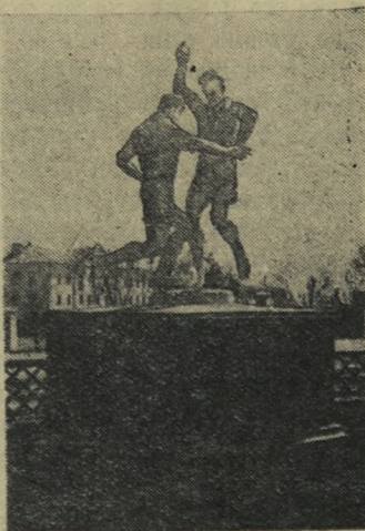
На снимке: Один из уголков нового стадиона Новотрубного завода.

Картофелем уже засажена половина площади.