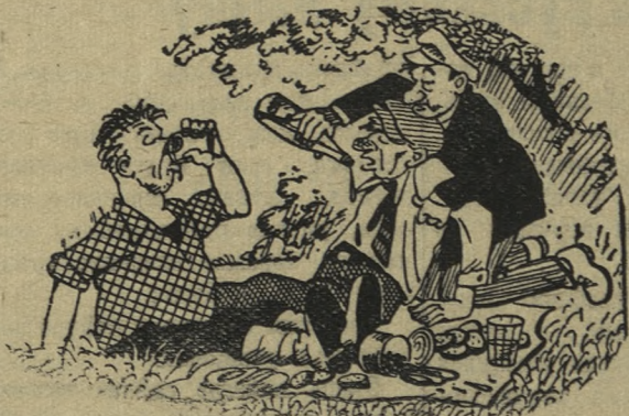
Отдохнуть, повеселиться, в их понятии — выпить.