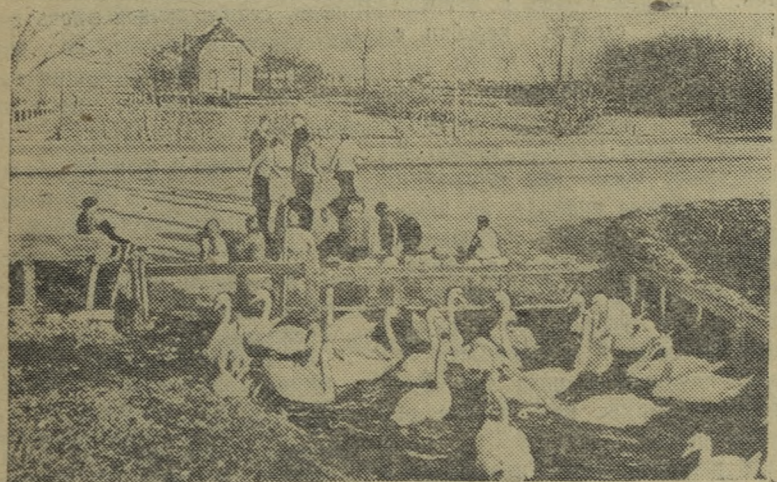
Голландия. На канале близ местечка Хоогмаде в окрестностях Лейдена.

Приемные экзамены будут проводиться 30 мая, 1 и 2 июня с 9 часов утра до 1 часа дня.