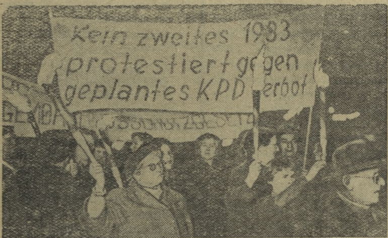
Федеральная Республика Германия. Факельное шествие протеста жителей Бремена против введения воинской повинности и запрещения КПГ.

Размещенные в выставочном зале экспонаты — плакаты, фотографии, газеты, книги рассказывают об истории Коммунистической партии Советского Союза, о жизни и деятельности гениального вождя международного пролетариата В. И. Ленина. Здесь же представлены произведения Ленина, переведенные на немецкий язык. В центре зала установлен бюст Владимира Ильича.