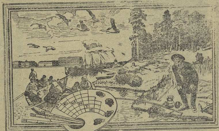
Рис. С. АНДРЕЕВА.

Из частей каких шести картин составлен этот рисунок? Кто авторы этих картин? Впишите их фамилии в клетках на палитре, используя уже имеющиеся буквы