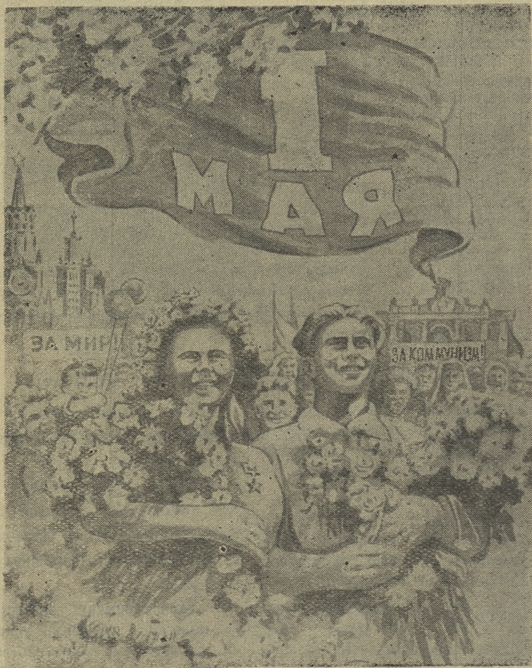
Рисунок П. Пипо.

Ты вернулась, Люсенька, Как воспоминание, Я тебя малюсенькой Знал когда-то ранее. То на подоконнике, То в саду, на лесенке Голосочком тоненьким Распевала песенки. Это было все давно, Дни бегут отчаянно. А вчера, вчера в кино Встретились случайно. Много скошено травы... Постарел уж видно я. Я сказал ей даже «вы». — Ты теперь солидная. Не видался столько лет Где же ты чудесила? И как прежде мне в ответ Рассмеешься весело. Взгляд был также детски чист, Только целая заботаю: — Я теперь специалист, Техником работаю. Ты вернулась, Люсенька, Как воспоминание. Я тебя малюсенькой Знал когда-то ранее.