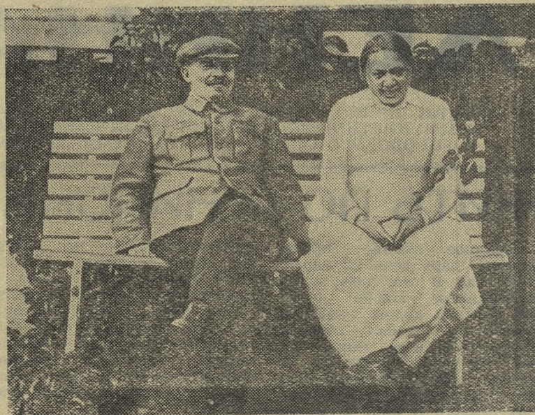
В. И. ЛЕНИН и Н. К. КРУПСКАЯ

В. И. Ленин указывал, что сила трудового примера получит громадное значение в социалистическом обществе. И не только потому, что люди просто будут следовать хорошему примеру, но и потому, что лучший пример организации производства будет сопровождаться неизбежным облегчением труда и увеличением