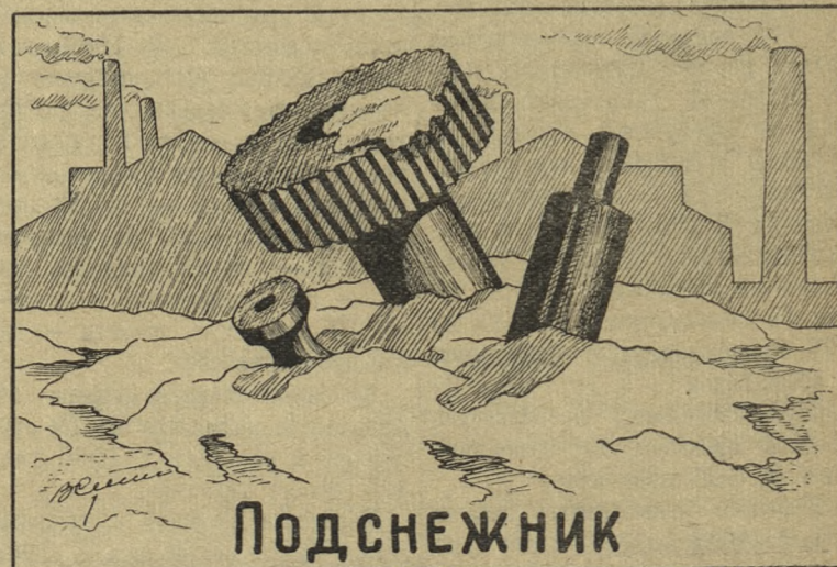
Рисунок В. Сумного.