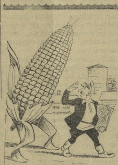
Смотрит он на кукурузу, Как на лишнюю обузу.

И тут же властной рукой сорвал газету, в которой его критиковали за поверхностное руководство первичными комсомольскими организациями.