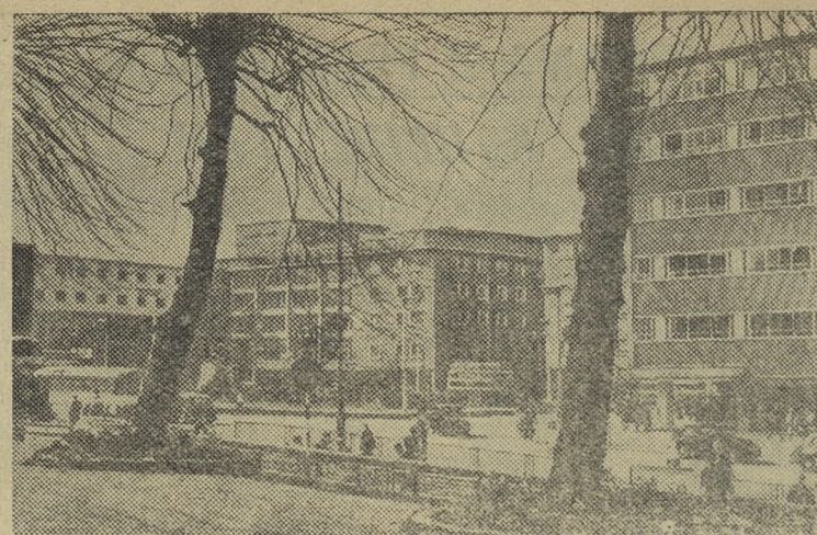
Англия. Часть восстановленных кварталов в городе Ковентри.

ЛОНДОН, 12 апреля. (ТАСС). По сообщению лондонского радио, в Южно-Африканском Союзе опубликована инструкция, согласно которой во всех автобусах на Капском полуострове европейцы могут занимать любые места, а «не европейцы» — специально отведенные для них места.