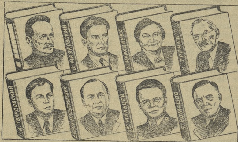
Рис. С. АНДРЕЕВА

Вспомните названия семи известных произведений семи авторов, изображенных на обложках книг. Если вы назовете их правильно, то из первых букв названий составится фамилия еще одного советского писателя. Впишите первую букву его имени и его фамилию в клетки на корешке книги с портретом этого писателя.