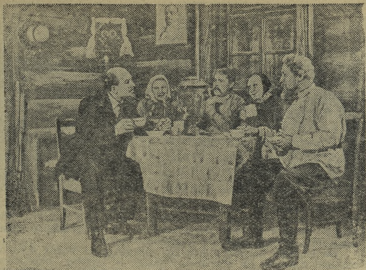
Венгерская Народная Республика. В Будапештском государственном театре имени Мадач с огромным успехом идет пьеса Н. Погодина «Кремлевские куранты».