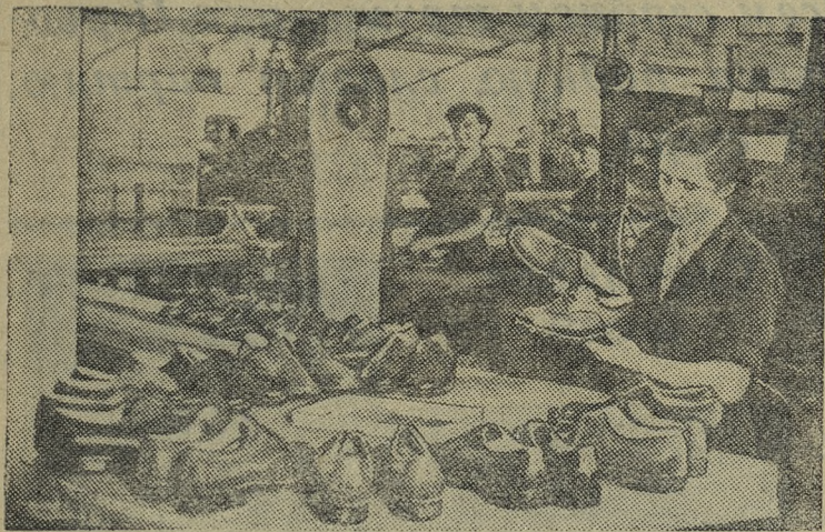
Польская Народная Республика. В цехе обувной фабрики в городе Хелмеке.